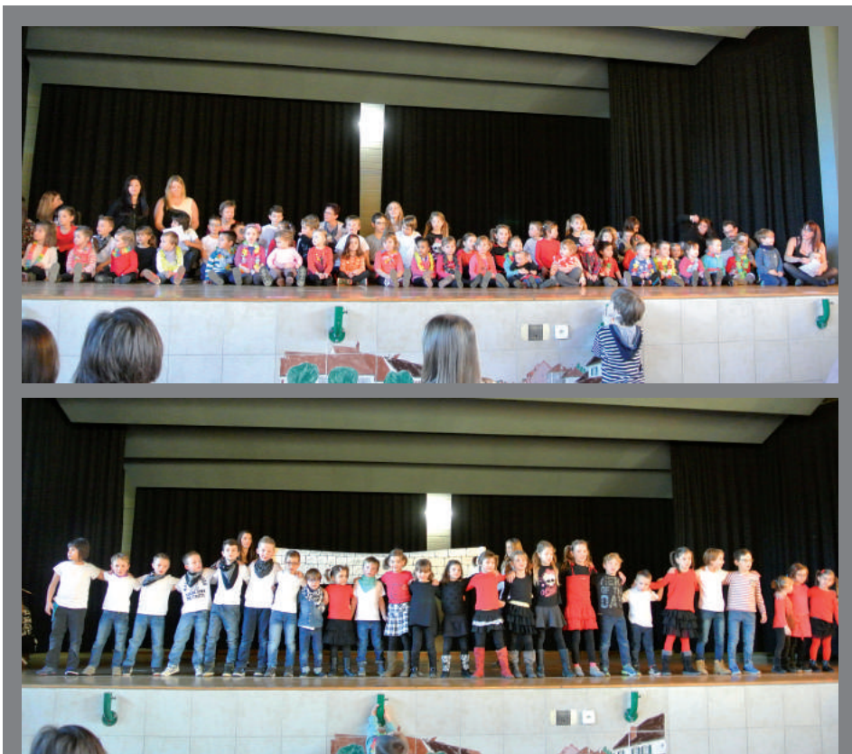
Plusieurs spectacles et chansons ont été présentés par les enfants.