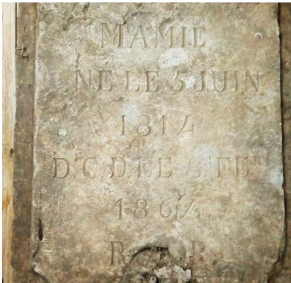
La pierre tombale retrouvée par l'équipe de la voirie.

Pour cette année 1814, le village d'Alle possède deux registres. L'un concerne les naissances (rédigé en langue française), l'autre concerne les baptêmes (rédigé en latin). Pourquoi donc ? Tout simplement parce que nous sommes ici à cheval sur deux régimes différents. L'un concerne le 1er Empire (notifié par l'officier d'état civil), l'autre la Restauration (notifié par les curés). L'acte de naissance qui est annexé