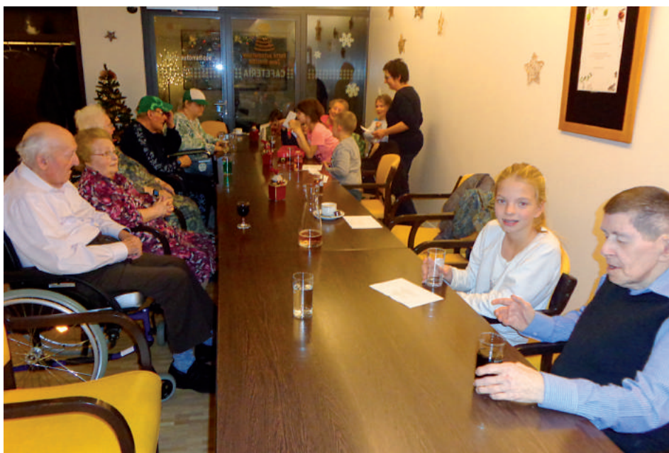
Les enfants de l'Equipe Jeunesse ont rendu visite aux personnes âgées du village d'Alle résidant au home Les Cerisiers à Charmoille.

Texte d'Agathe Surgand et Marie-Lise Courtet