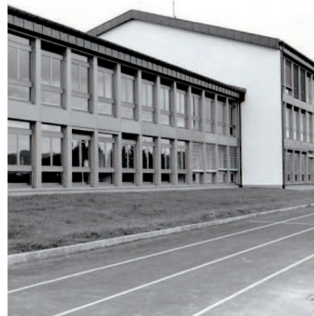
Il y a 40 ans, en 1977: Inauguration du nouveau collège primaire à la Terrière.