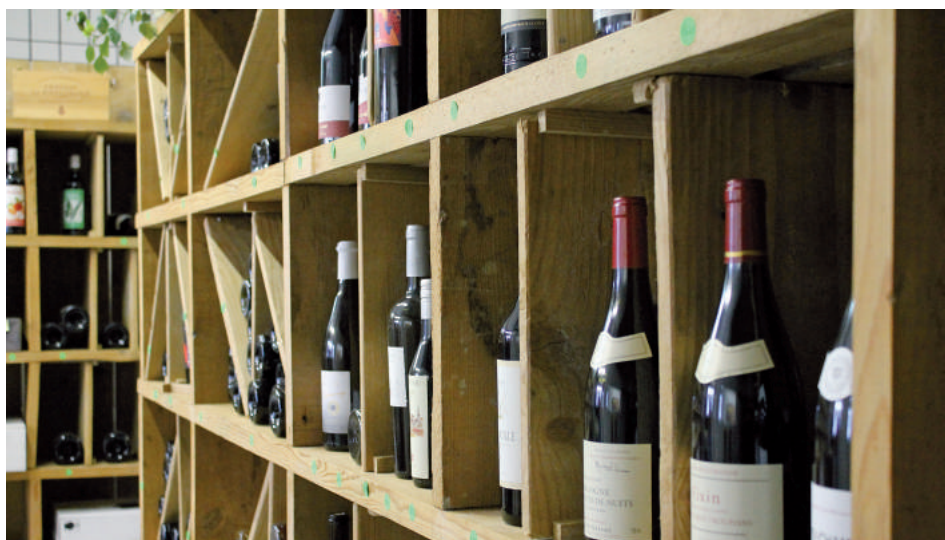
Un assortiment de boissons variées est disponible directement au magasin.

Petignat Sàrl propose aux particuliers un large choix de vins sélectionnés pour leur qualité et leur ensoleillement. De plus, des conseils professionnels sont proposés aux clients indécis pour choisir le meilleur vin