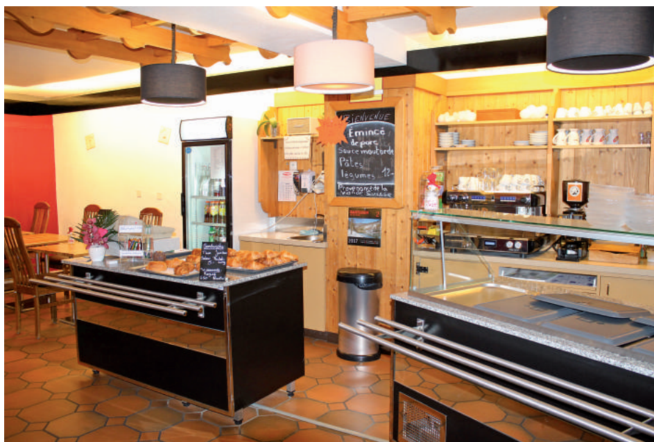
Le Rég'Alle, un cadre sympathique pour un moment convivial.

C'est en octobre 2015 que Mme Dominé, originaire de Courchapoix et ajoulote de cœur, décide de réaliser un vieux rêve, celui d'ouvrir son propre restaurant. C'est avec son beau-fils, actif au façonnage du pain, qu'elle se lance dans l'aventure et jette son dévolu sur le village d'Alle pour son incomparable attractivité. La nouvelle propriétaire travaille essentiellement avec les commerces et fournisseurs de la région et utilise, autant que faire se peut, les produits locaux pour confectionner, au quotidien, le menu du jour servi à midi. Les petites faims à toute heure, des sandwiches frais du jour sont proposés sur place et à l'emporter et livrés aux personnes âgées.