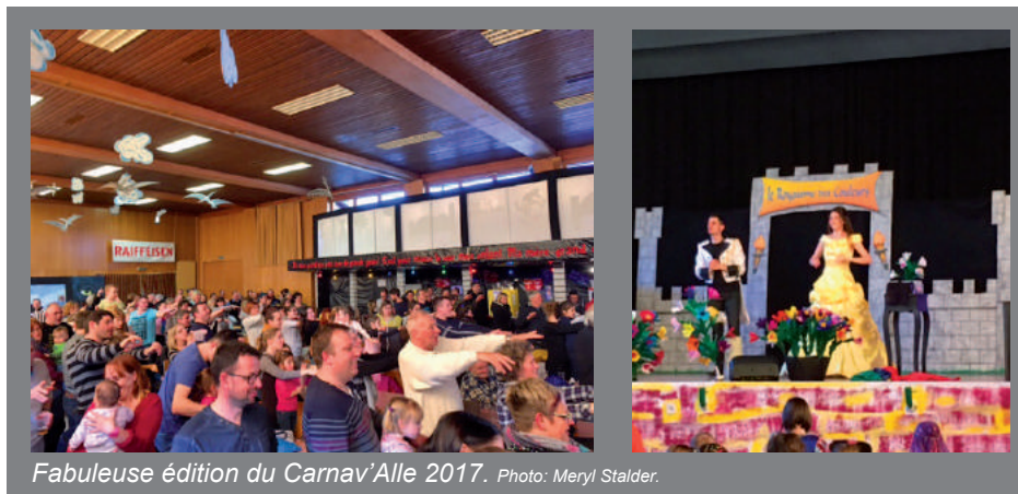
Fabuleuse édition du Carnav'Alle 2017.