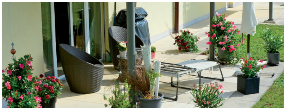
L'édition 2016 du concours «Alle, village fleuri» dont le thème était «A fleur de pot» avec ci-dessus un magnifique aménagement floral.

Les premiers bourgeons apparaissent. C'est le signe que les travaux de jardinage peuvent débuter. Pour soutenir vos efforts et orienter votre créativité, le thème choisi pour l'année 2017 est «Un jeu de fleurs renversant».