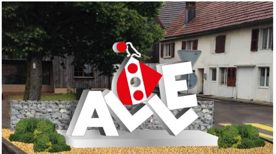
Un photomontage en 3 dimensions représentant la future enseigne qui sera située à la Place de la Liberté.