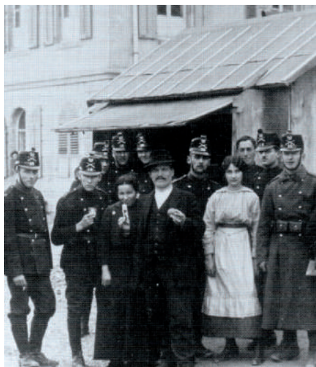
Il y a 100 ans, en 1917: Ouverture du premier kiosque à Alle, rue de l'Eglise (centre du village).